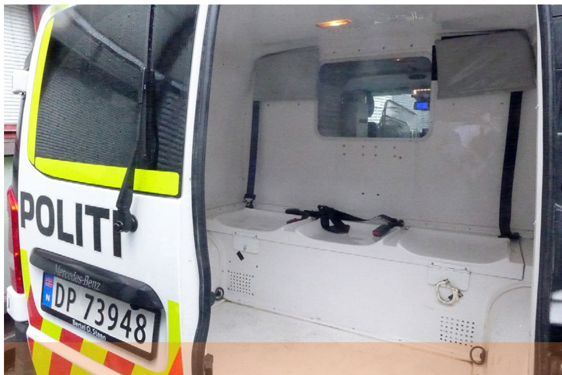
Bakrommet på en av politiets cellebiler.

friheten som en siste utvei, og bare for et kortest mulig tidsrom. 7