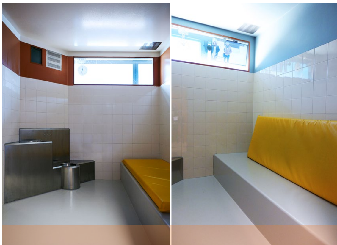
Celler ved Oslo sentralarrest. Til venstre (rød vegg): Vanlig glattcelle. Til høyre (blå vegg): Celle for mindreårige, med TV bak glass i vindu.

Det er en klar risiko for at vilkåret «tvingende nødvendig» ikke blir vurdert, når det i praksis ikke finnes alternativer til celle for mindreårige. Dette bar også den skriftlige dokumentasjonen preg av. I flertallet av loggføringene vi gjennomgikk fra alle landets politidistrikter, var det brukt standardiserte fraser som «sakens alvorlighet» eller «øvrige omstendigheter», eller at annen plassering var «vurdert, men ikke funnet hensiktsmessig» som begrunnelse for å plassere en mindreårig på celle. I enkelte tilfeller var det ikke loggført noen vurderinger av alternativer til celle.