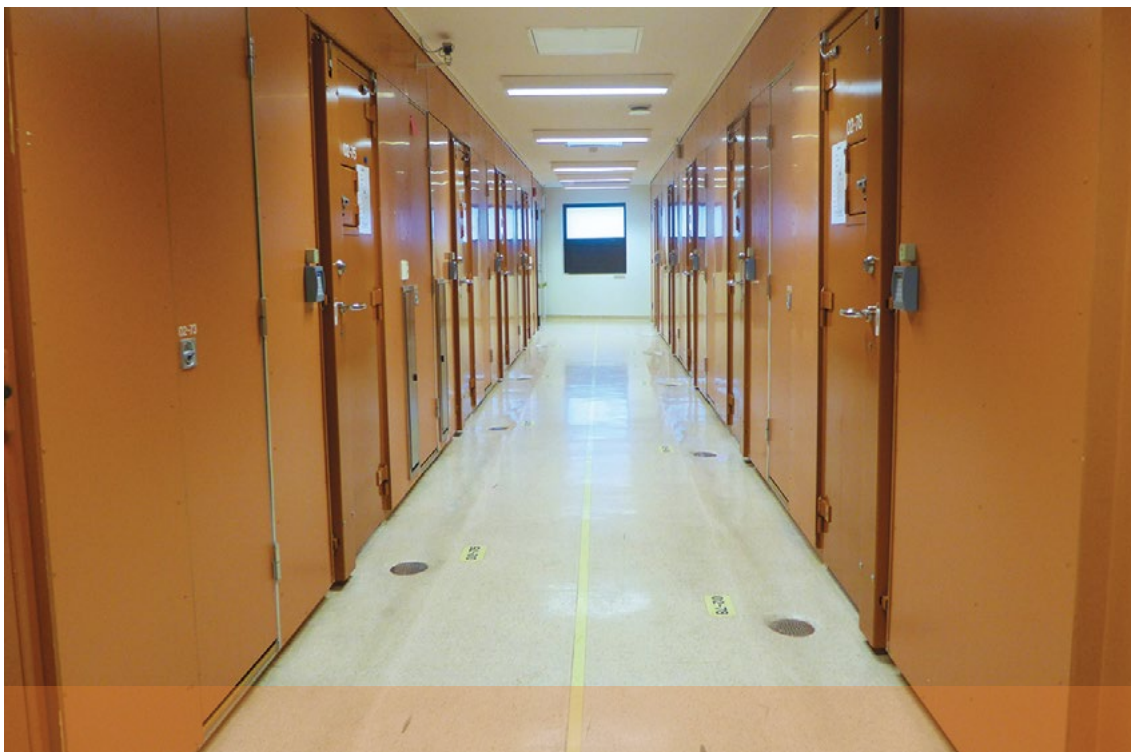
Korridor i Oslo sentralarrest.